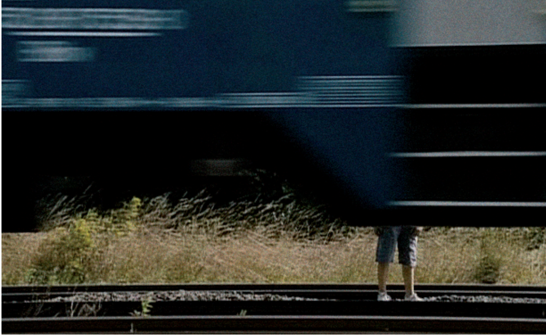
Filmkocka Can Togay Vonat című rövidfilmjéből 2009

Filmstill from the short Train by Can Togay 2009