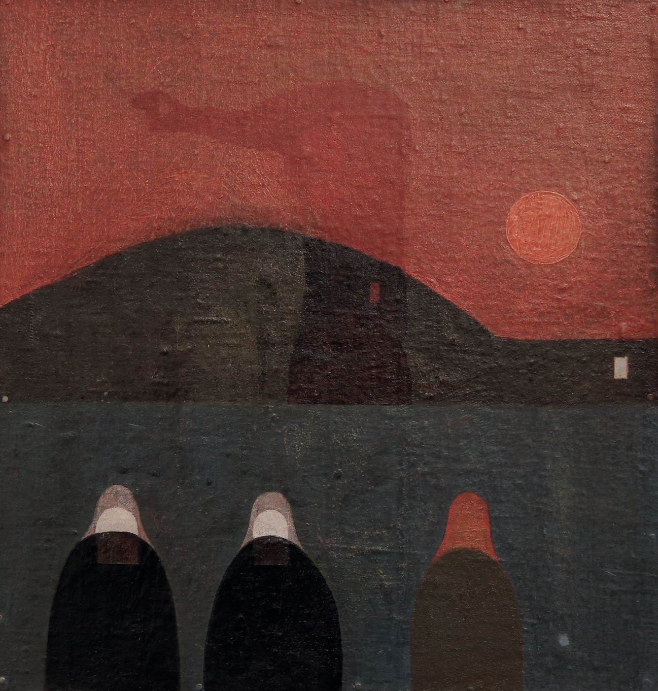
Bálint Endre: Várakozók II. Waiting II, 1958 olaj, fa oil on wood, 37,5 × 39,5 cm