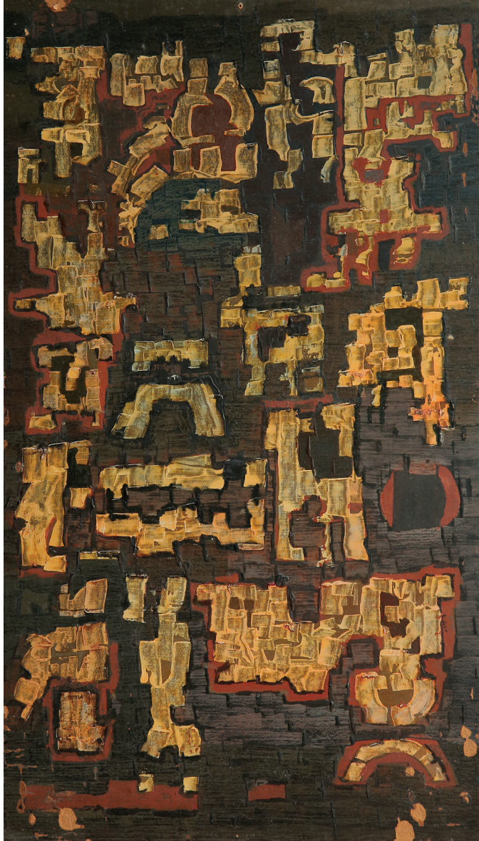
Ország Lili: Cím nélkül | Untitled, 1960-as évek, 1960s olaj, farost | oil on fiberboard, 60 × 35 cm

Számos közkedvelt bábfigura, köztük a népszerű Misi Mókus vagy a Mazsola megalkotójaként ismert Bródy Vera 1951-től dolgozott az Állami Bábszínházban. A művészet iránti fogékonysága több területen is megmutatkozott. Először hegedülni, majd rajzolni