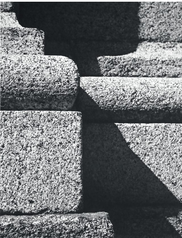
Lucien Hervé: L'Escorial, Madrid, 1959 fotó, ezüstszelatin nagyítás | photograph, gelatin silver print, 450 × 340 mm