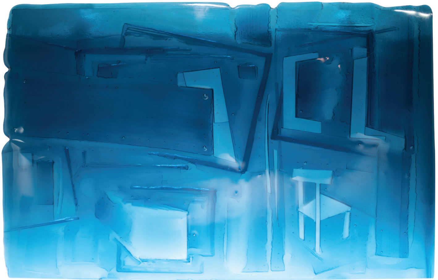
László Kyrá: Csöndszoba | Room of Silence, 2021 rogyasztott üveg | slumped glass