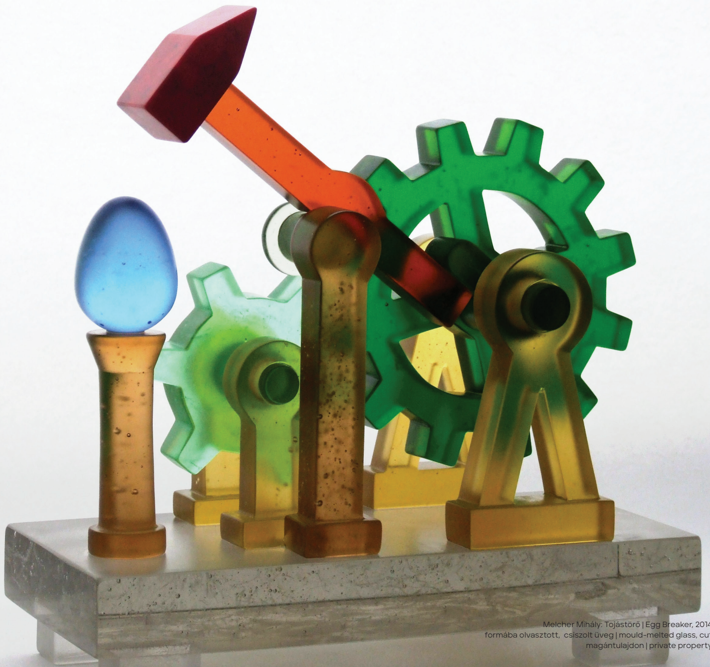
Melcher Mihály: Tojástörő | Egg Breaker, 2014 formába olvasztott, csiszolt üveg | mould-melted glass, cut magántulajdon | private property