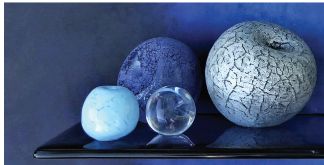
Hegyvári Bernadett: Kék csendélet (részlet) | Blue Still Life (detail), 2021 fúvott üveg, akril, fa | blown glass, acrylic on wood

Smetana Ágnes már pályakezdése óta a természetben közvetlenül megfigyelt növényi formák, alakzatok, az évszakonként változó vegetáció színhar-