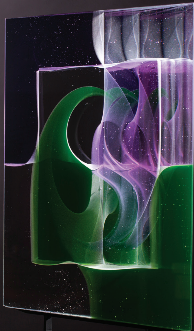
Borkovics Péter: Levendula | Lavender, 2022 összeolvasztott színes síküveglapok, melegen formázva fused and hotformed color flat glass